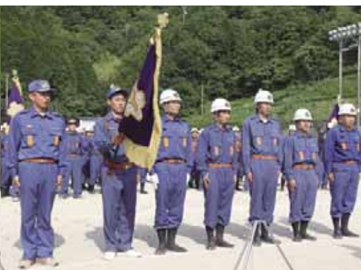
小型ポンプの部優勝 城辺方面隊 第3分団垣内支部