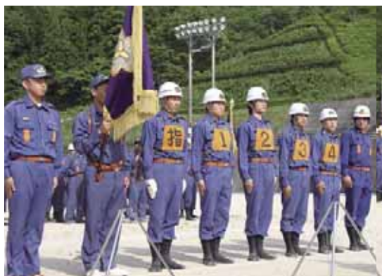
ポンプ車の部優勝 城辺方面隊 第1分団城辺中支部