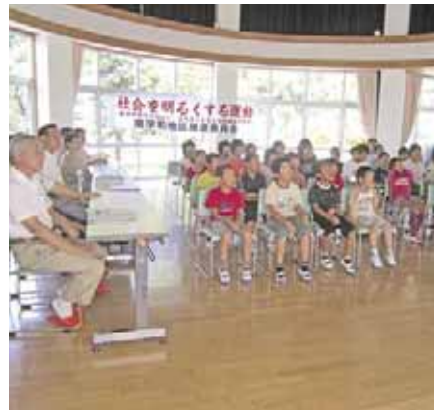
社会を明るくする運動学習会

7月の強調月間では、広報パレードや作文コンテスト、学習会など各種啓発活動を予定しています。皆様のご理解とご協力をお願いします。