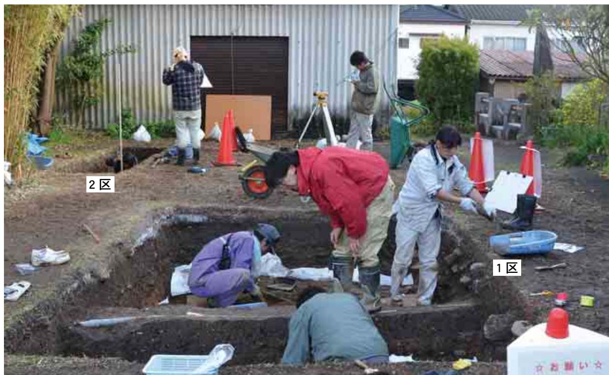
第6次発掘調査の状況。平城貝塚における貝層南端部の確定を目的として第1調査区(写真手前)を、貝層の外周における空間利用の検証を目的として第2調査区(写真左奥)の調査を行いました。