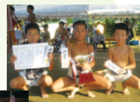
団体戦低学年の部優勝 城辺A