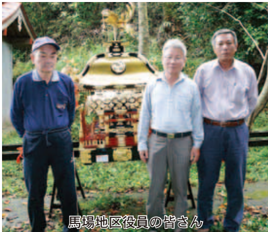
馬場地区役員の方々

この事業は「宝くじの普及広報事業」として自治総合センターが受け入れた宝くじ収益を財源として、住民が自主的に行うコミュニティ活動の促進を図り、地域の連帯感に基づく自治意識を盛り上げることをめざすもので、コミュニティ活動に直接必要な施設又は設備の整備を行っています。