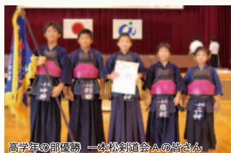
高学年の部優勝 一本松剣道会Aの皆さん