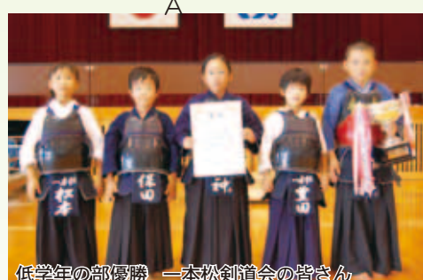
低学年の部優勝 一本松剣道会の皆さん