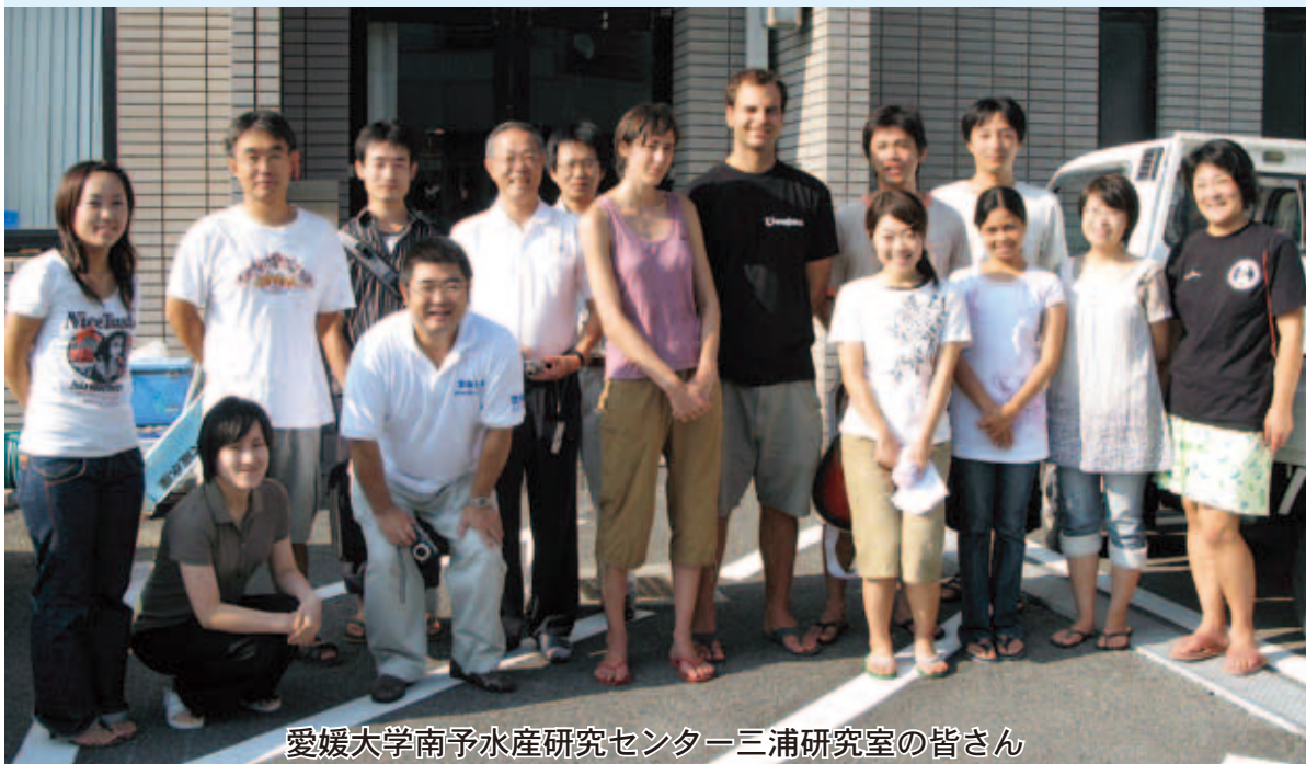
愛媛大学南予水産研究センター三浦研究室の皆さん