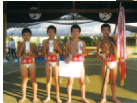
団体戦高学年の部優勝 赤水