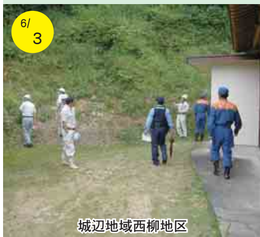
城辺地域西柳地区

この事業系ごみは、法律で自らの責任で適正に処理することと定められています。ところが、この事業系ごみを家庭系ごみのステーション(集積場所)に出していたり、一部の住宅密集地では道路脇に置いてある事業所が見うつけられ、この行為は違法行為となります。本来、自らが環境衛生センターに持ち込むか、本町許可業者に直接連絡し収集運搬してもらわなければなりません。事業系ごみは適切な方法で処理しましょう。