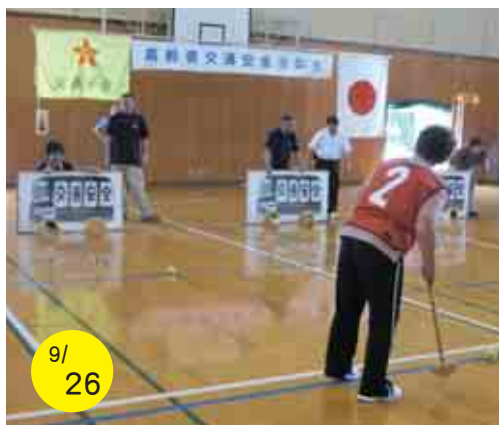
高齢者交通安全運動会