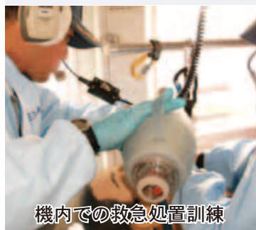
機内での救急処置訓練