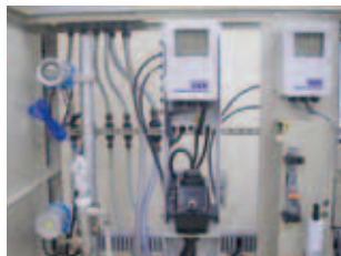
浄水水質検査計器