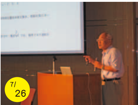
7/26 防災のための地域参画

「平成22年度地域エンパワーメントカレッジ」が開講され、4日間にわたって愛南町連合婦人会の会員をはじめ延べ118名の参加者が、地域社会・防災・DV・地域ネットワーク等様々な分野を男女共同参画の視点で学習しました。