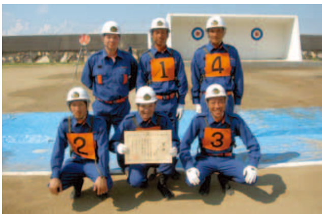
愛南町消防団城辺方面隊第1分団城辺下支部チーム