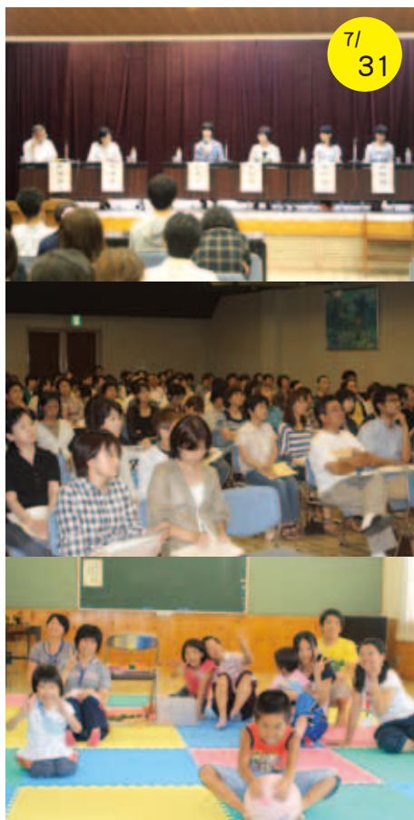
託児コーナーで仲良く