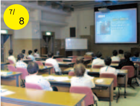
7/8 知っていますか？ ドメスティック・バイオレンス