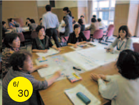
6/30 ワークショップ (地域の課題、理想等)

「平成22年度地域エンパワーメントカレッジ」が開講され、4日間にわたって愛南町連合婦人会の会員をはじめ延べ118名の参加者が、地域社会・防災・DV・地域ネットワーク等様々な分野を男女共同参画の視点で学習しました。