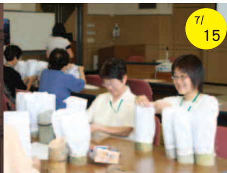
7/15 人と人 繋がる力は地域力 (灯籠作り)