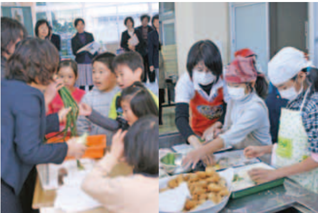
船越小学校公開授業

これまで実施していた事業を拡充し、町内の小中学校で指定校を決め、2年間学校・家庭・地域と連携した食育の研究に取り組みます。また、町内各方面への「食育」の情報発信の場として、研究発表会を開催します。