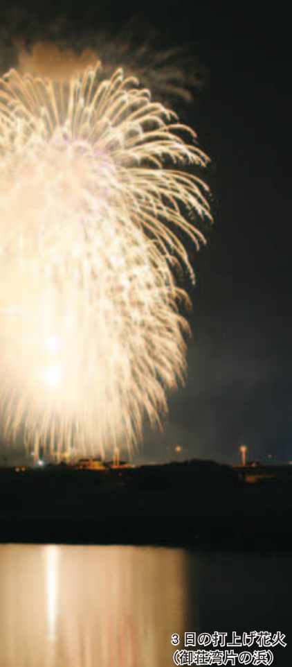
3目の打上げ花火 (御難波片の浜)