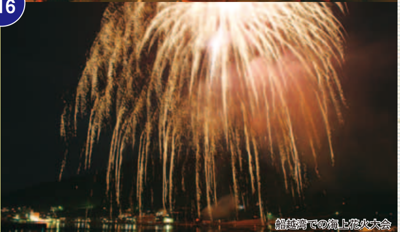
船越湾での海上花火大会

西海町民会館駐車場で、降りしきる雨の中「西海海中公園まつり」が行われ、餅ちまきや地元福浦小学校の「風の子太鼓」、一本松地域のフラダンスチーム、レーモンド松屋、鬼城太鼓、ガイヤ踊りなど、出演団体の熱気に包まれた夏まつりとなりました。 また、県内でも珍しい1尺5寸玉を含む約2,000発の花火が上がる「海上花火大会」の頃には、雨もすっかり上がり、海に映る色鮮やかな光り模様に、あちこちで大きな歓声が上がっていました。