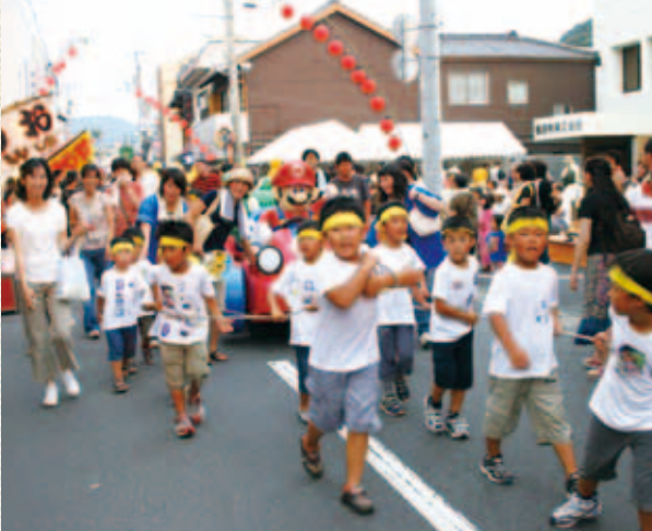
樽みこしパレード