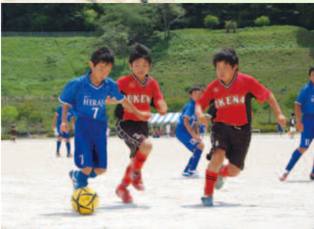
小学6年生以下の部