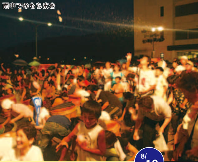
雨中でのもちまき