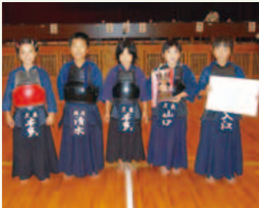
小学生低学年の部 1位 城辺・久良連合