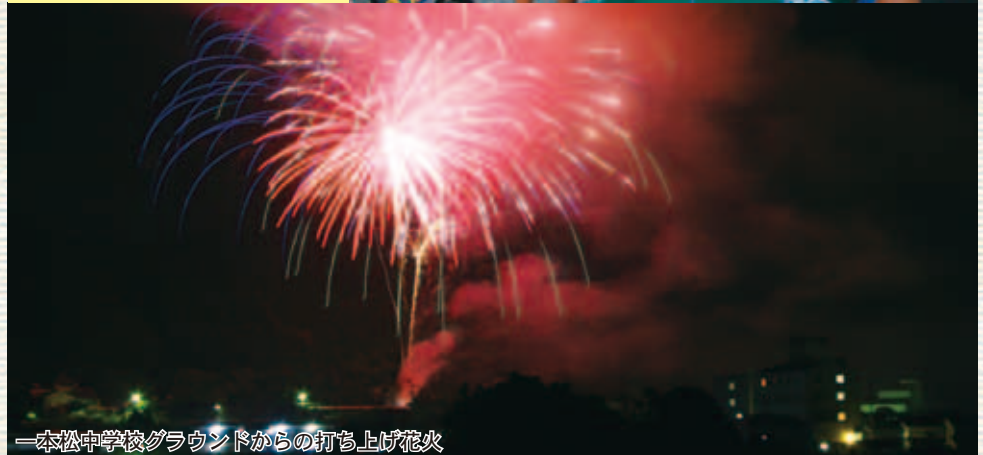
一本松中学校グラウンドからの打ち上げ花火