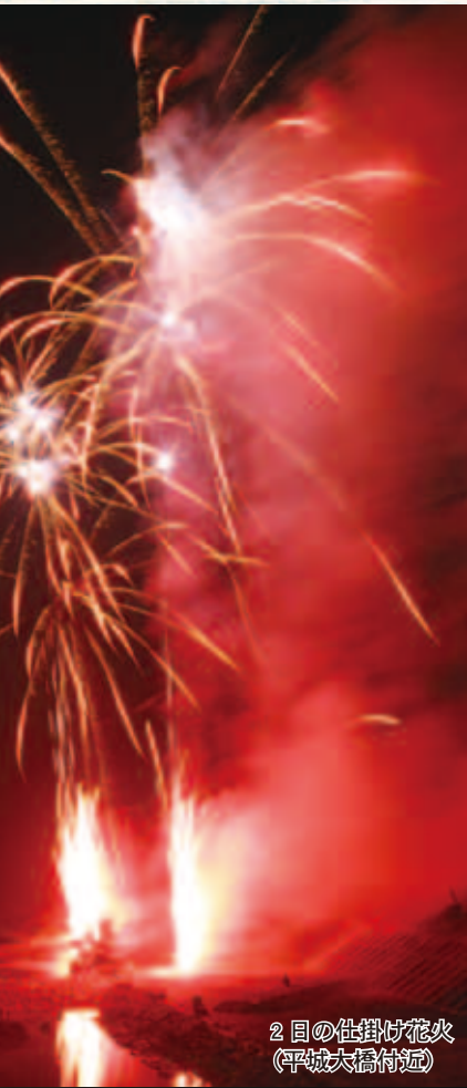
2目の仕掛け花火 (平城大橋付近)