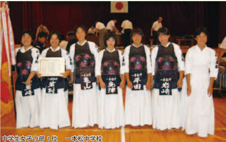
中学生女子の部 1位 一本松中学校