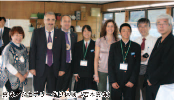
真珠アクセサリ作り体験（若木真珠）

モリナセカ町との交流事業」に行かせていただきました。交流事業は、モリナセカ町にも愛南町にもある巡礼路がきっかけで行われました。モリナセカ町長らは、観自在寺を参拝した後、サンパールにて記念石柱の除幕式を行いました。また、アクセサリ作りや紫電改を観覧するなど、愛南町・日本の魅力を満喫していらっしゃいました。これからさらに、モリナセカ町との交流が深まっていくことを、愛南町民の一人として心から願っています。