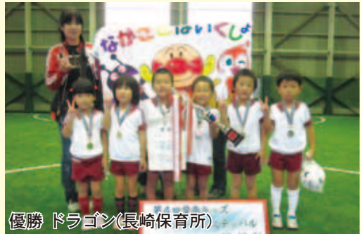
優勝 ドラゴン(長崎保育所)