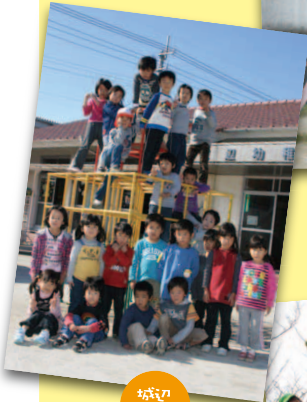
城辺 こぶた保育園