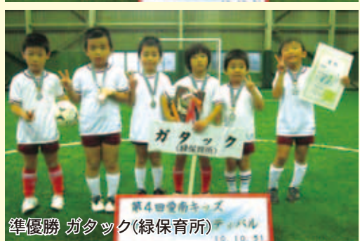
準優勝 ガタック(緑保育所)