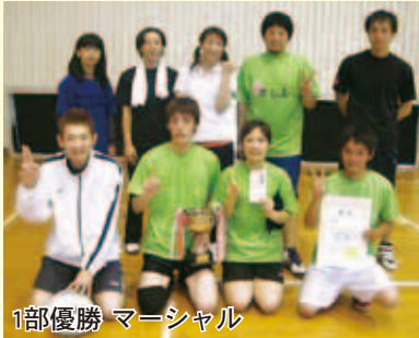
1部優勝 マーシャル

御荘B&G海洋センター体育館と平城小学校体育館で、「第10回フレンドリーカップソフトバレーボール大会」が行われ、1部10チーム、2部8チームの合計18チーム、約140名が参加し、楽しく競い合いました。