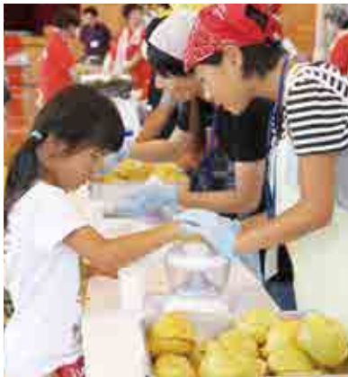
愛南ゴールド生搾り体験

当日は天候にも恵まれて多くの方が会場を訪れ、真珠アケセサリ、こけ玉、絵はがきや竹細工などを作る文化創作体験、ピザ作りや愛南ゴールド生搾りなどの食文化体験で、来場者の皆さんは楽しい一時を過ごしていました。また、野外販売コーナーや田舎レストランも大変好評でした。