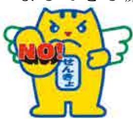
贈らない・求めない・受け取らない

■年賀状等のあいさつ状の禁止 政治家は年賀状等のあいさつ状を出すことが禁じられています。