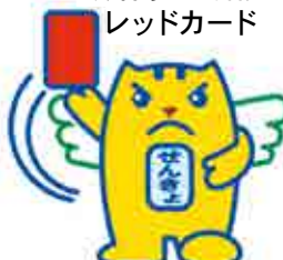
政治家の寄附は レッドカード

政治家の関係団体の寄附の禁止 政治家が役員や構成員である団体が、政治家の氏名を表示して選挙に関する寄附を求めると処罰されます。