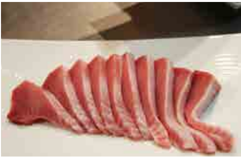
試食会で出されたスマの刺身

どのおいしさです。現在町内養殖業者2社が来年度の出荷をめぐらして養殖を行っており、その新しい特産品を全国に発信しようとして、びやびやかつお広め隊のメンバーなど25人が試食会に参加しました。試食会では、スマの出荷が始まった際にどういったメニューで提供できるかなど、愛南町の新しい特産品の誕生を期待して様々な意見が飛び交いました。