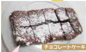
チョコレートケーキ