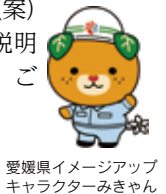
愛媛県イメージアップキャラクターみぎゃん