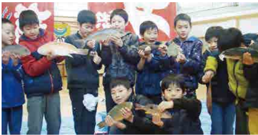
魚に触れる“魚触”を体験する篠山市立西紀北小学校の児童

この出前授業は、篠山市と愛南町の姉妹都市交流事業の一つとして、海や水産物に触れるこ