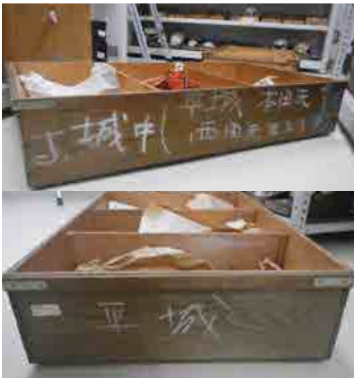
新潟大学医学部での保管状況（一部）

その後、骨から年代を測定したり、当時の食性が復元できる研究が進み、本年度、国立歴史