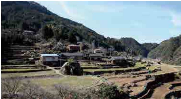
遊子川地区の風景写真