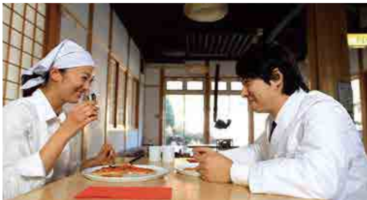
映画「食堂ゆすかわ」のワンシーン