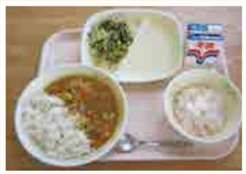
4月の学校給食 「愛南新玉ねぎカレー」です!

食育の日には、大きな声で「いただきます」「ごちそうさま」といったり、家族全員そろって楽しく食事をするなど、ご家庭でも少し「食」を意識してみてください。