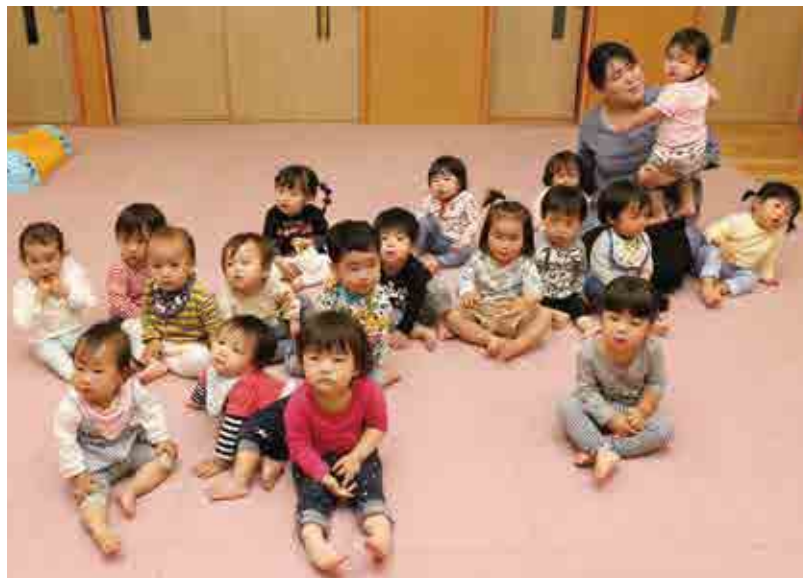
●はまゆう乳幼児保育所 すみれ組【1歳児】 毎日元気に遊んでま～す!!