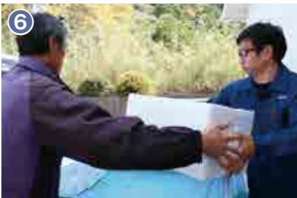
6 付着器を容器に入れ、4月から5月頃に愛南町の母貝養殖業者に稚貝を出荷します