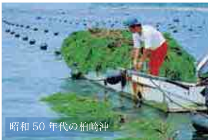
杉葉を海につけて稚貝を採取する「天然採苗」