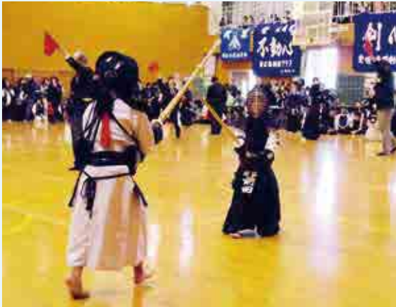
熱戦を繰り広げる少年剣士たち