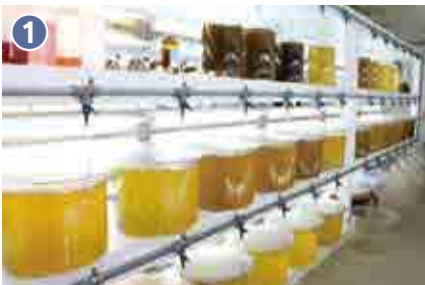
1 海洋センターの飼料室でアコヤガイの餌となる植物プランクトンを培養しています