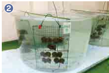
2 選抜した親貝を約1か月間飼育し、採卵の準備をしています