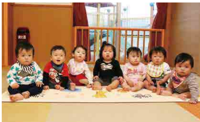
●はまゆう乳幼児保育所 れんげ組【0歳児】 お座りも上手になったよ。いっぱい遊んで大きくな～れ!