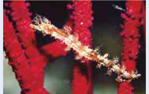
タツノイトコとヤギ (サンゴの仲間)

タツノオトシゴは、みんなが知っている魚の一つだろう。水族館で本物を見た人も多いのではないだろうか。漢字で「竜の落とし子」と書くことから、昔の人も竜を想像したのだろう。泳ぎは苦手で、ヤギや海草に体を巻き付けてユラユラしていることが多い。愛南の海にも生息しており、ダイバーにも人気の魚である。よく知られている魚だが、数は少なく、自然の中で見つけるのは簡単でない。