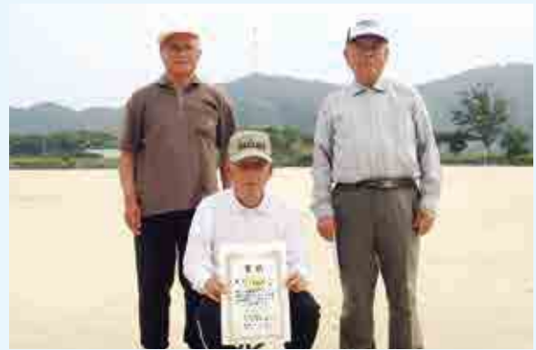
優勝 一本松 B