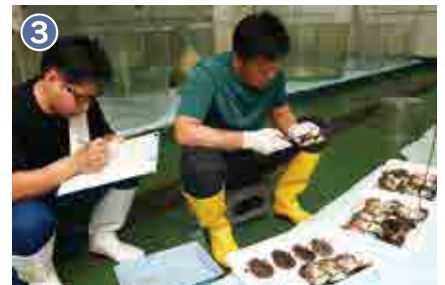
3 親貝の肉質や真珠層などから品質を評価し、採卵に用いる貝を決定します