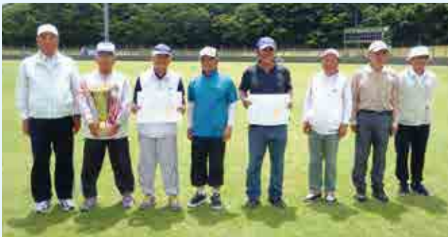
左から城辺クラブ A・愛南広見 B