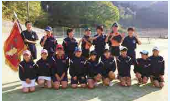
女子団体 優勝 城辺中 A

愛南町御荘 B&G 海洋センターで「第25回フレンドリーカップソフトバレーボール大会」が行われ1部、2部合わせて12チームが参加して熱戦を繰り広げました。