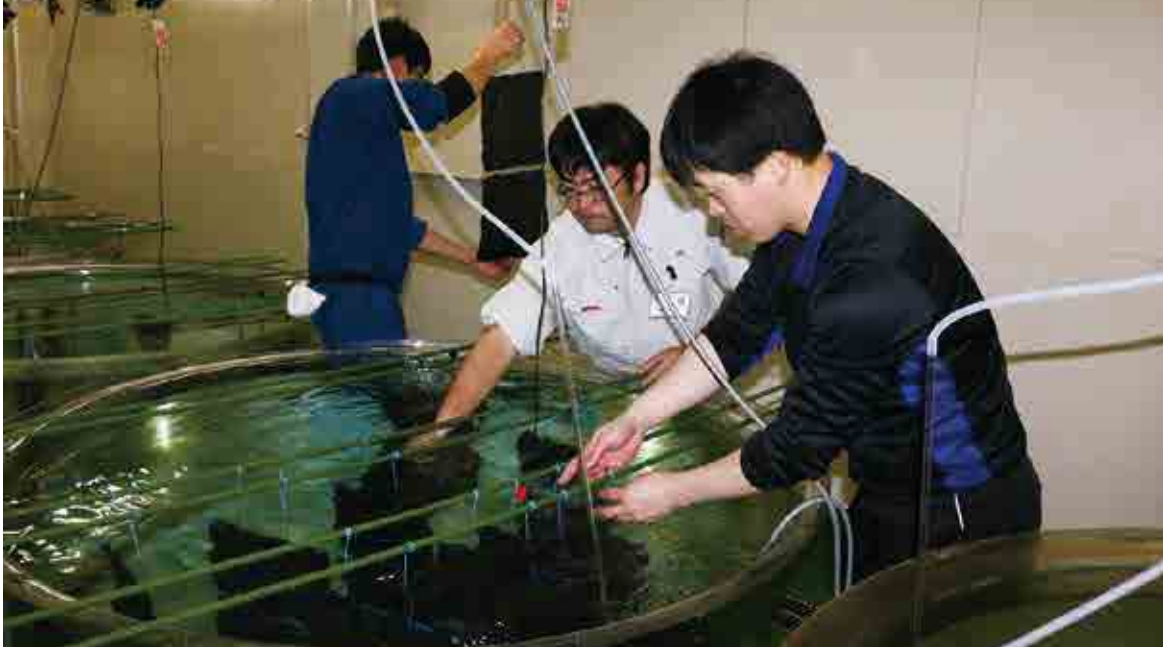
愛南町海洋資源開発センターにおけるアコヤガイの稚貝出荷の様子

水産業が盛んな愛南町。漁船漁業や魚類養殖のほか、内海地域を中心に真珠母貝養殖が盛んに行われています。 真珠母貝とは真珠を生み出す貝のことを指し、日本では主にアコヤガイが用いられています。愛南町は日本一の母貝産地であり、真珠養殖の出発点となっています。