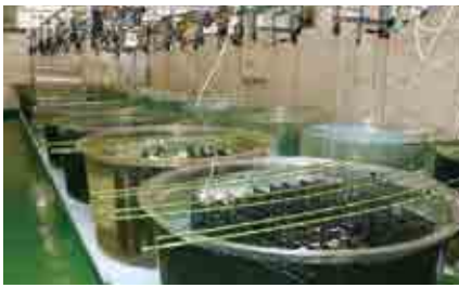
海洋センターの施設内で稚貝を人工的にふ化させる「人工採苗」