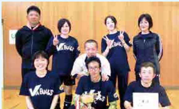
2部 優勝 ぶぁブルス