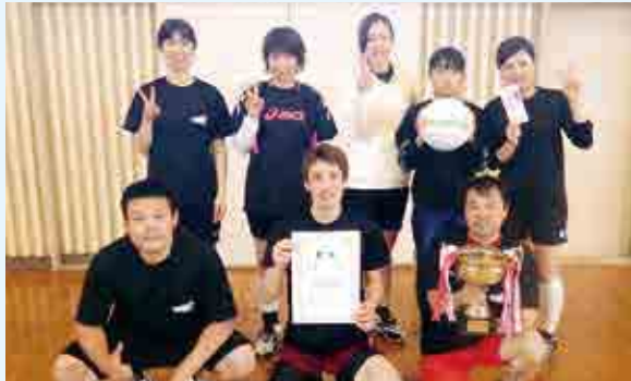
1部 優勝 irodori Z