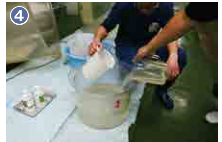
4 選抜した優良な親貝から卵と精子を取り出し、人工的に授精させます