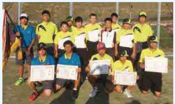
男子団体 優勝 御荘中 A