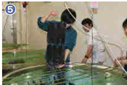
5 約40日間飼育した後、付着器と呼ばれる黒いネット1枚には2mm程の稚貝が約1万個付着しています