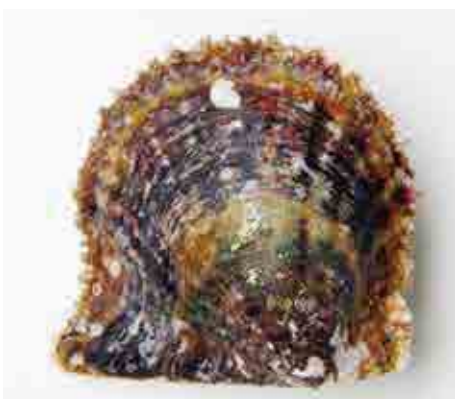
真珠母貝として用いられるアコヤガイ