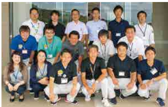
農林課・農業支援センター・農業委員会の職員がお待ちしています！