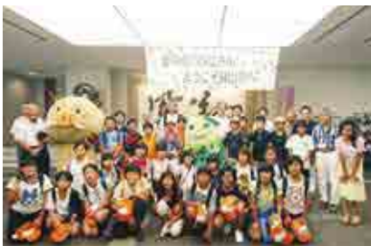
篠山市に到着し、歓迎を受ける愛南町子ども親善訪問団

2 泊3日の日程で愛南町の子とも親善訪問団25人が姉妹都市である篠山市を訪問し、市の小学生と交流を行いました。昨年、篠山市の小学生が愛南町を訪れたことに続く2度目の開催となり、一行は、陶芸体験や篠山城跡の散策を通じて、篠山市の文化に触れ、新しい友達と夏休みの思い出を作りしました。