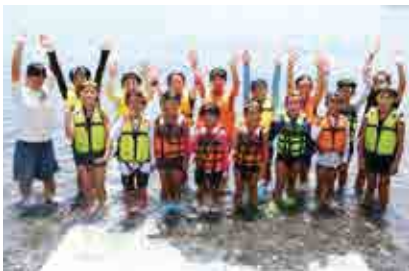
中玉分館前の海で交流学習会を行った東海小学校と大野ヶ原小学校の児童

全 校児童9人の東海小学校が全校児童8人の西予市立大野ヶ原小学校を招いて、交流学習会を開催しました。海と山という異なる環境にありながら、同じような規模、児童全員が女子という2校。児童は東海公民館中玉分館で海の活動やバーベキューを楽しみながらひと夏の思い出を作りしました。