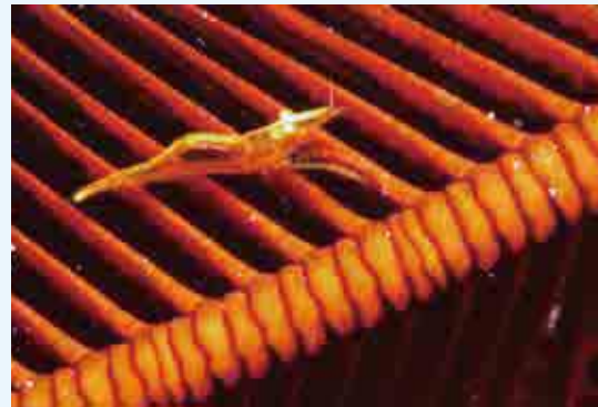
ウミシダとウミシダヤドリエビ

この腕の中をじっくり探していると、運がよければウミシダヤドリエビを見つけることができる。体の色をウミシダと同じに変化させるた