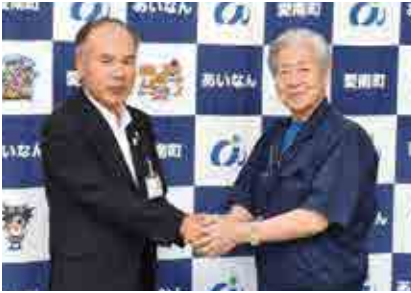
愛南町役場を訪問した荒木泰臣全国町村会会長（右）と岡田敏弘副町長

岡田敏弘副町長が町内の被災状況などを説明すると、荒木会長は、復興に向けた激励の言葉を述べました。