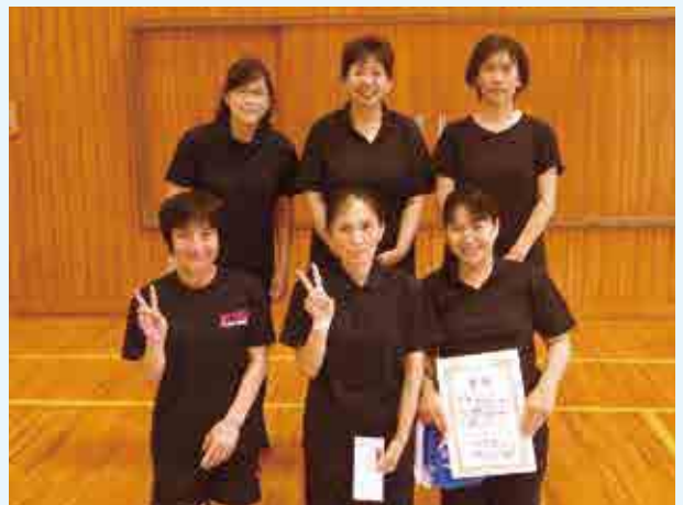
2部優勝 カメレオン