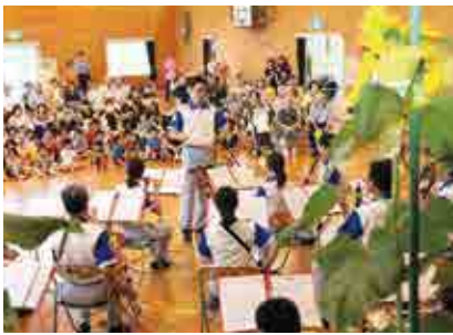
愛媛県警察音楽隊の演奏を楽しみながら交通事故根絶の意識を高める参加者

京 都府から全国に広がり、命の大切さや交通事故防止を呼びかけている「ひまわりの絆プロジェクト」があいな幼稚園で行われました。園児や地域の方など約100人が参加して、愛媛県警察音楽隊の演奏や愛南署劇団「なーし一座」の公演を楽しみながら、交通事故根絶の意識を高めました。