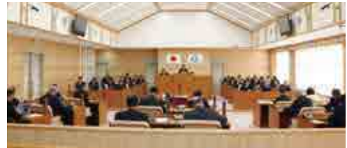
平成30年第4回議会定例会

初日には、3人の議員が一般質問を行い、最終日には、補正予算、条例改正等についても審議・可決しました。