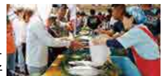
昨年のカツオ販売の様子

愛南町の魅力をぎゅぎゅっと詰め込んだ楽しいイベントです。お誘い合わせのうえ、ぜひともお越しください。