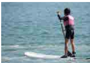
SUPを楽しむクラブ員

▶年会費 1名 5,000円 (研修事業等に参加する場合、随時参加費を徴収します)