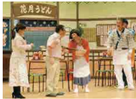
満員の会場を沸かせた吉本新喜劇の一場面