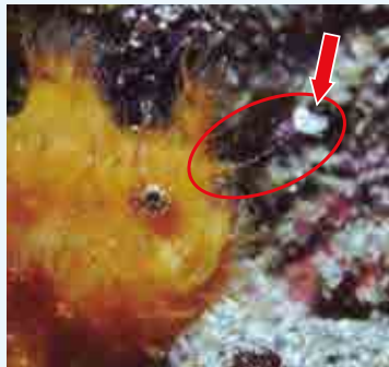
釣りをしているところ