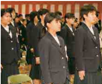
「仰げば尊し」を歌う城辺中学校の卒業生