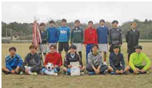
1部優勝 ファミリーJr