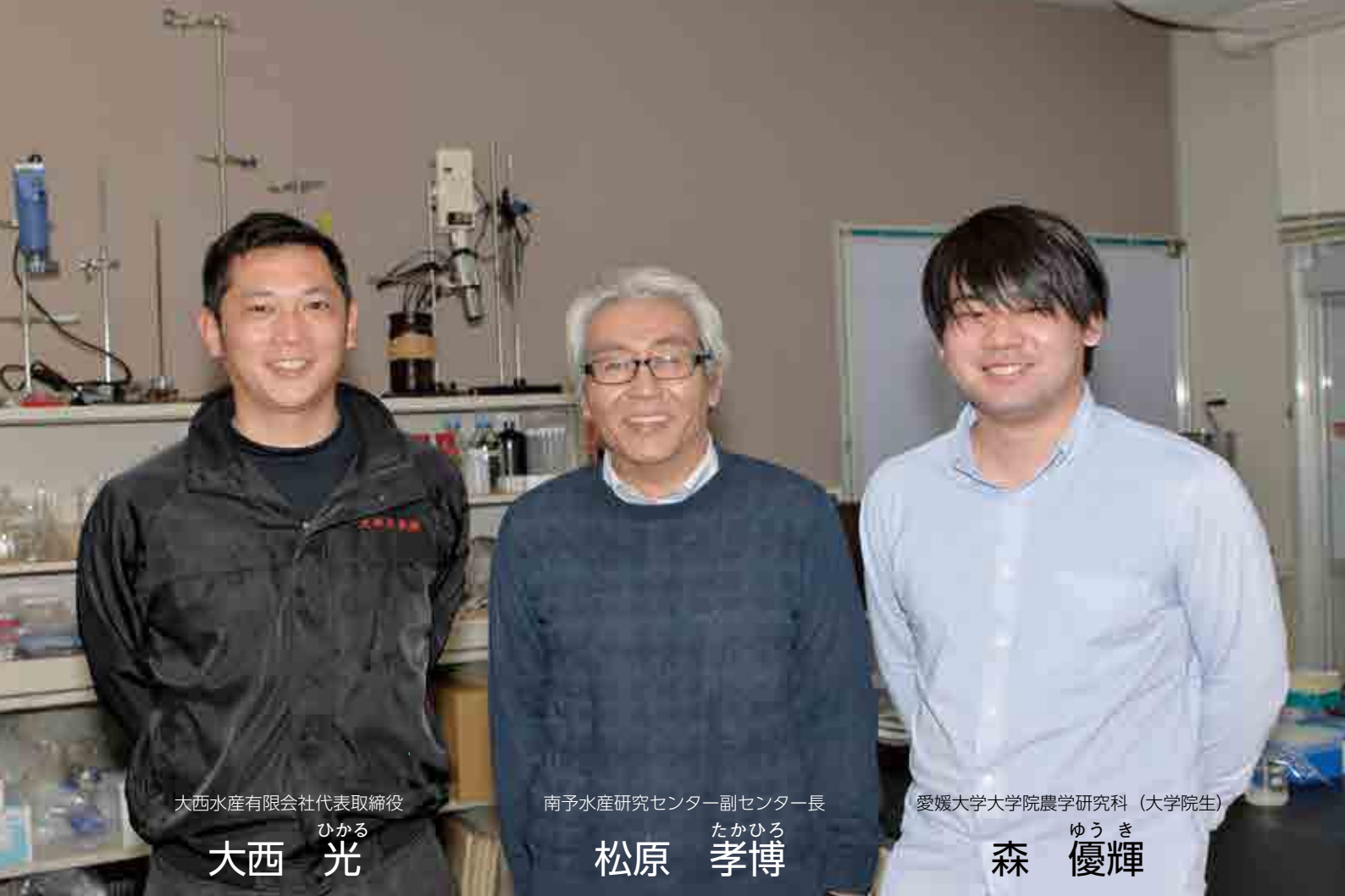
大西水産有限会社代表取締役