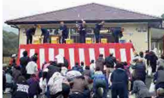
集会所の完成を祝って行われた餅まき

落成式には、関係者や地区住民らが参加し、集会所完成を祝って賑やかに餅まきが行われました。