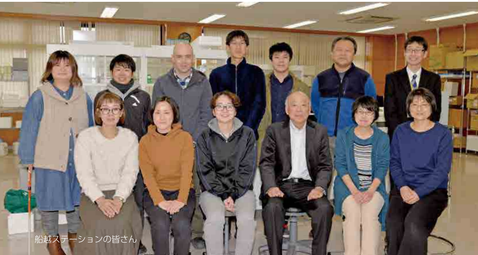
船越ステーションの皆さん