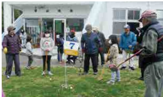
グラウンドゴルフを楽しむ御荘グラウンドゴルフクラブの会員と小学生