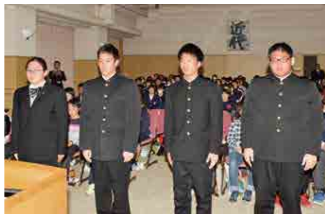
体育協会表彰を受ける南宇和高校の選手たち

本町の体育・スポーツ活動の発展に資することを目的として、平成20年度から行われているもので、受賞者に対して表彰状とメダルが授与されました。