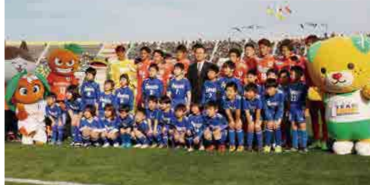
上／愛媛FCの選手と手を繋いで入場する愛南キッズ 下／愛媛FCの選手との試合前の記念撮影