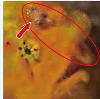
釣竿をしまったところ

桜の開花が聞かれるよい気候となった。おだやかな春の陽射しの中、釣果は二の次でのんびりと釣り糸をたれるのが私の楽しみの一つである。