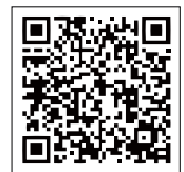
愛南町ホームページ