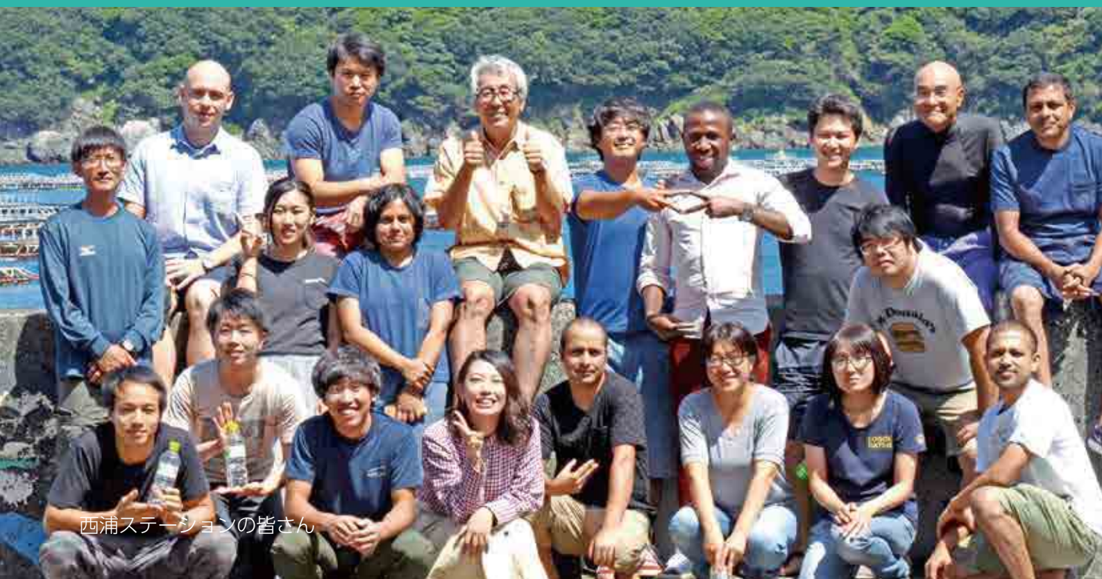
西浦ステーションの皆さん