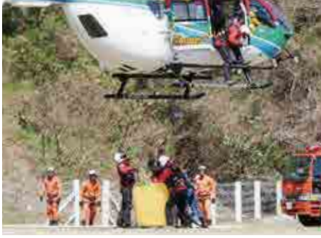
低空にとどまって給水を行う防災ヘリ

火 災防御活動に必要な知識や技術を習得することなどを目的に、愛媛県消防防災航空隊と愛南町消防本部が南レク城辺球技場で合同訓練を行いました。