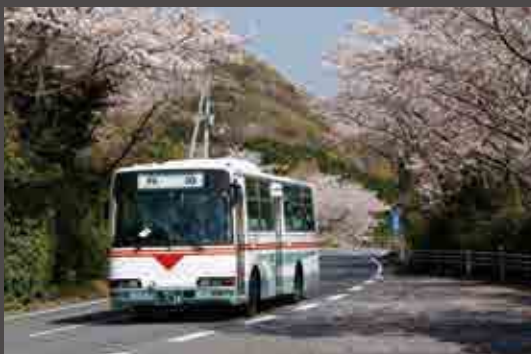
「桜のトンネルを行く」