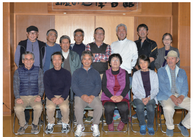
「愛南フォトクラブ」の皆さん

写真展開催やイベントの撮影協力、ケーブルテレビ「びやびや愛南タイム」内の「愛南フォトクラブ30秒」コーナーへの投稿など幅広く活動しています。