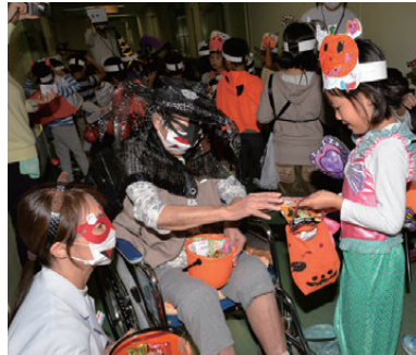
仮装で患者に元気を与える子どもたち

国保一本松病院で「ハロウィンパーティー in 一本松病院」が開催され、職員や入院患者らがハロウィンの衣装に仮装して地元の一本松小学校児童を迎え入れました。