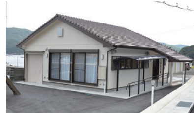
落成した下久家集会所

老朽化に伴う新築工事を進めていた下久家集会所(木造平屋建)が9月30日(月)に完成し、落成を祝う地域住民らが集い餅まきが行われました。