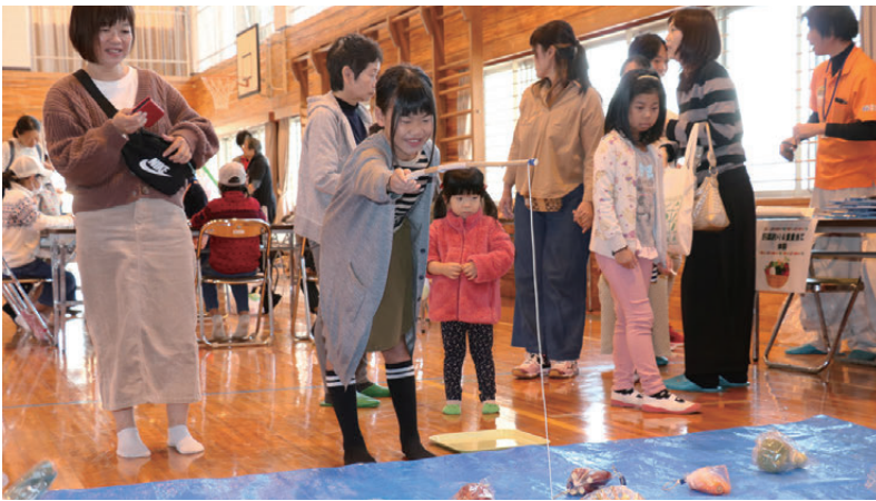
野菜釣り＆重量当て体験

旧満倉小学校屋内運動場で「GT(グリーン・ツーリズム)秋の子ども大収穫祭～全員集合!!～」(愛南グリーン・ツーリズム推進協議会主催)が開催され、親子連れなど約50人が参加しました。