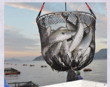
▲ ブリの水揚げ風景。1年半から2年ほどかけて4～6 kg台に育てて出荷しています。