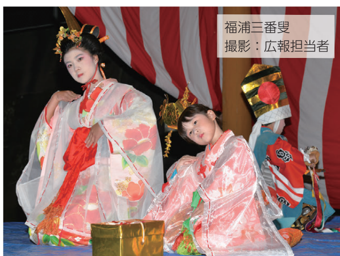
福浦三番叟