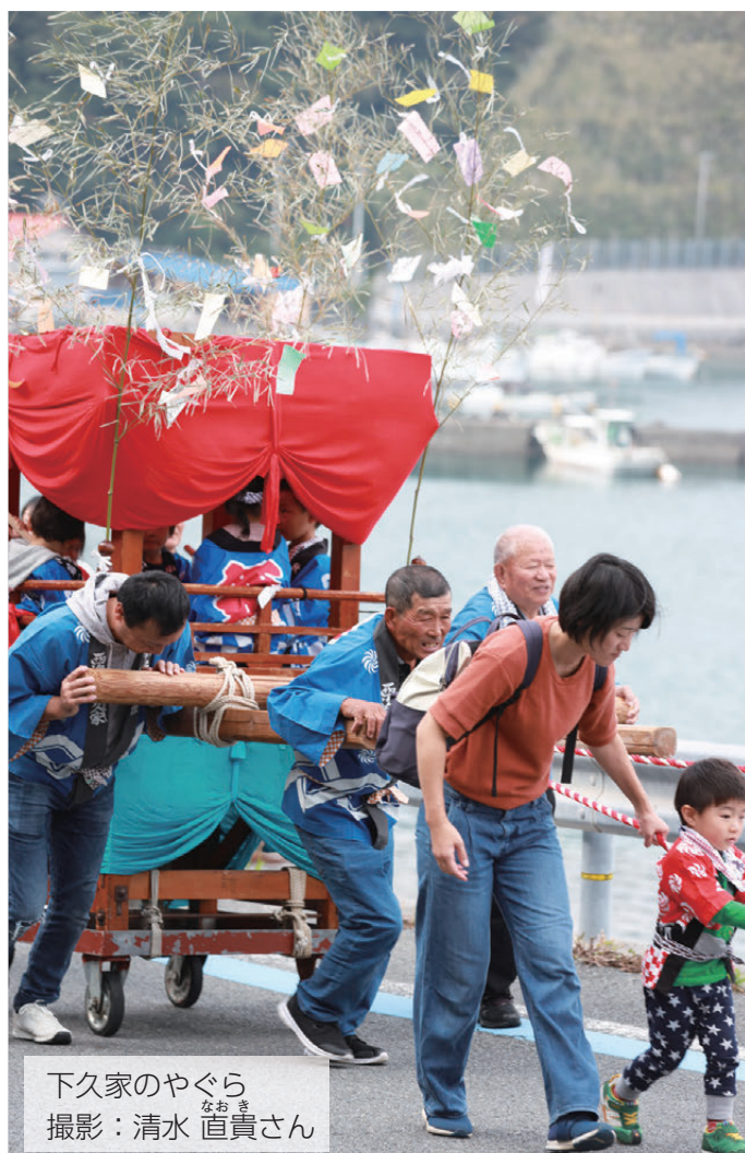
下久家のやぐら