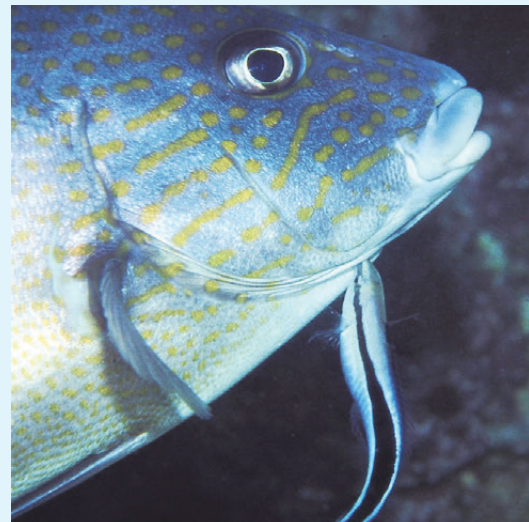
【掃除中のホンソメワケベラ】