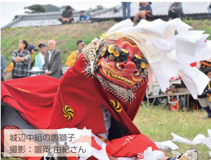
城辺中組の唐獅子 ゆき