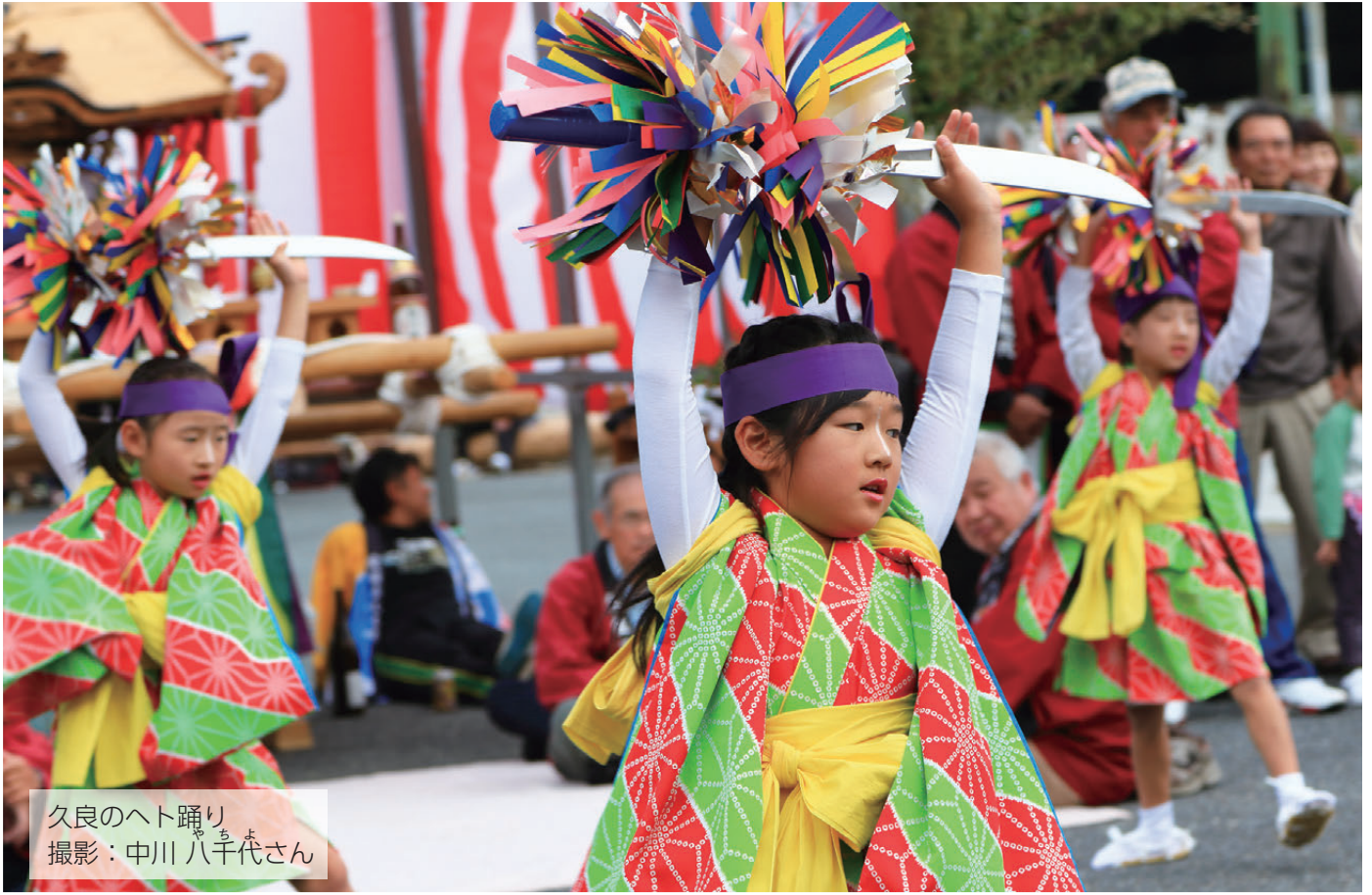
久良のへつ踊り