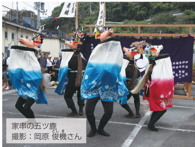
家串の五ツ鹿 としき