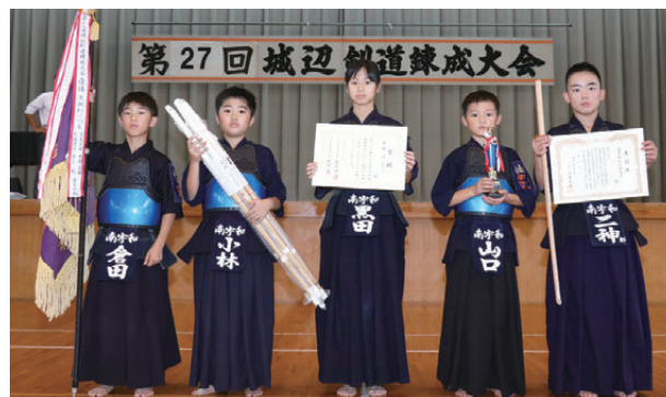
団体戦高学年の部 優勝 南宇和剣道会