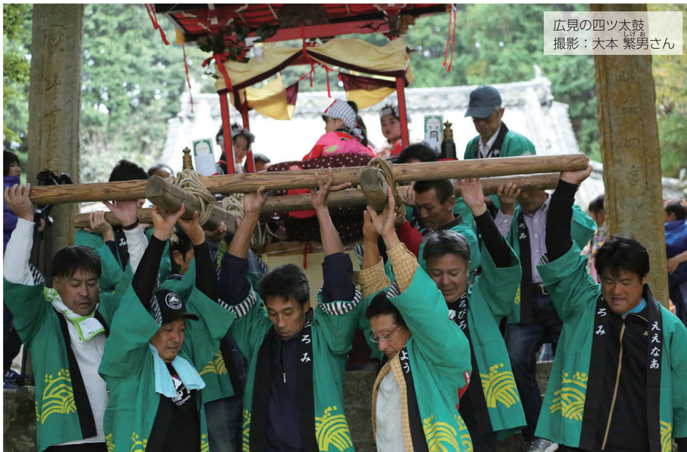
広見の四ツ太鼓