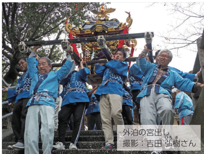
外泊の宮出し