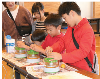
温州ミカン生搾り体験