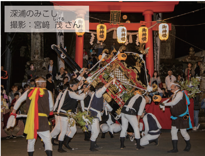
深浦のみこし しげる