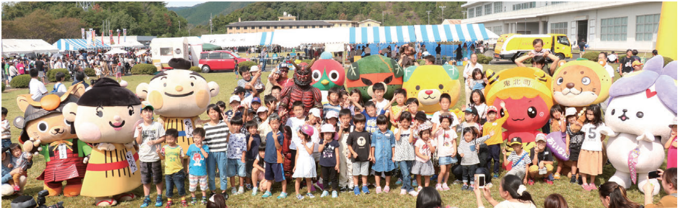
各地域ご当地キャラクターたちと記念撮影

愛南町の秋の味覚を味わってもらうと、「愛南まるゴチ秋の味覚祭」(愛南食のイベント実行委員会主催)がレクザム愛南工場敷地内(広見地区)で開催されました。