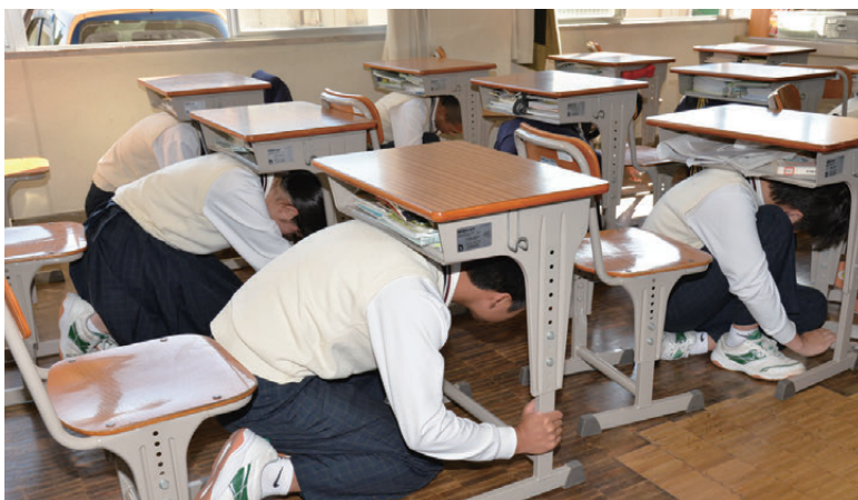
机の下に身を隠す生徒