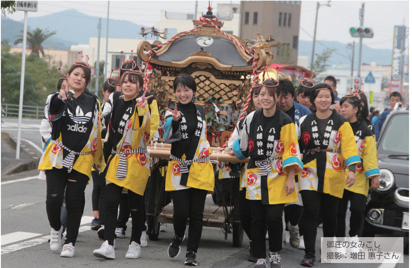
御荘の女みこし けいこ