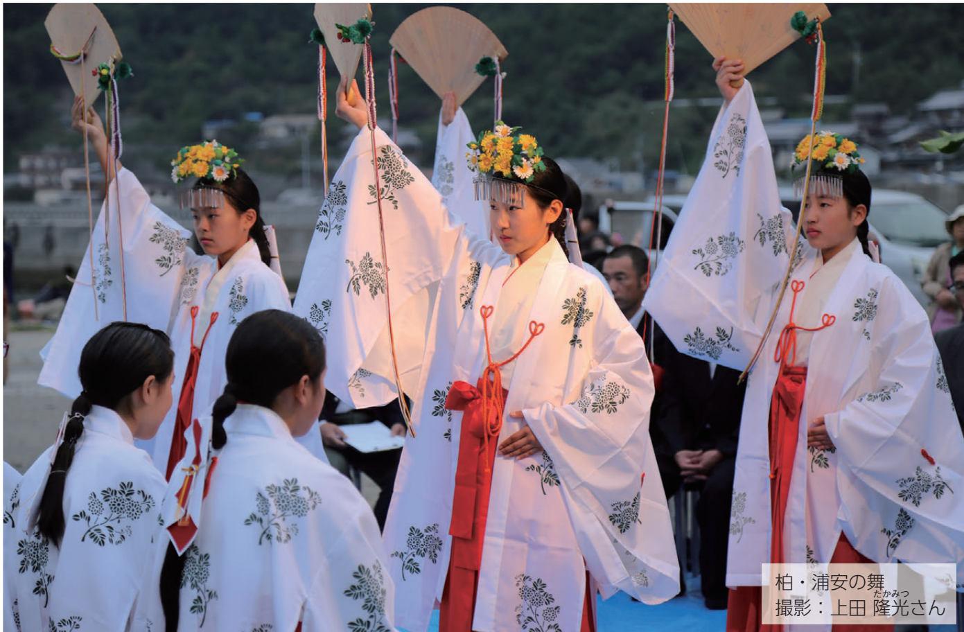
柏・浦安の舞 たかみつ