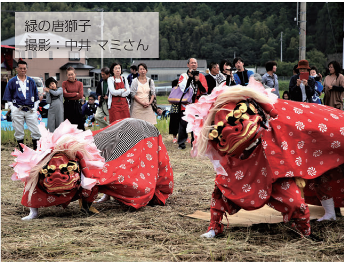
緑の唐獅子