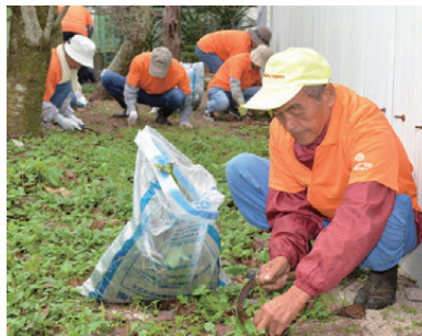
事務所周辺で草刈りや草引きを行う会員