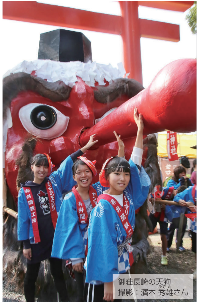
御荘長崎の天狗 ひでお