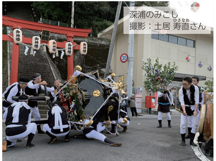
深浦のみこし