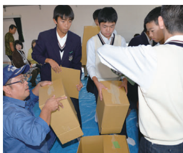
地域住民や消防署の職員と一緒に避難所準備

地震による災害からできるだけ早く避難するための能力や態度を身に付けるとともに、避難所生活への理解を深めることを目的に、城辺中学校体育館で校区内の自主防災会・消防団と城辺中学校の合同による避難訓練が行われました。城辺地域全体でこういった防災訓練が実施されるのは初めてのことです。