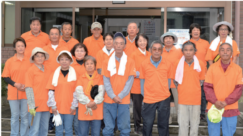
シルバー人材センターの会員や職員の皆さん

10月の「シルバー人材センター事業普及啓発月間」に合わせて、愛南町シルバー人材センターの会員や職員など19人が、約1時間かけて事務所周辺の除草作業を行いました。