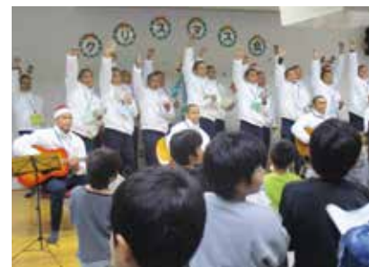
インドネシアの漁業技能実習生も参加したクリスマス会

これからも地域の方々や子どもたちと交流を深め、愛南町でたくさんの事を学び、健康で安全に、そして明るく過ごしてほしいと思います。