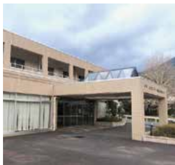
内海保健センター