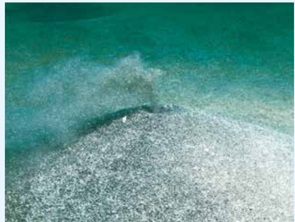
【ゴカイの仲間の巣】

いくつもあり、あちらこちらで噴煙を上げている。実際の噴火を見たことはないが、上空から見るとこんな感じなのだろうなと思いながら写真を撮った。