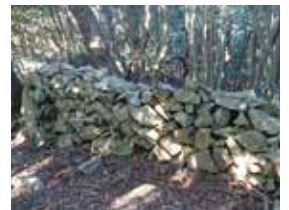
外泊地区のシシ垣