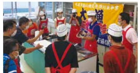
▲町内で養殖マダイのさばき方などを学ぶ「愛南マダイ応援隊」の学生