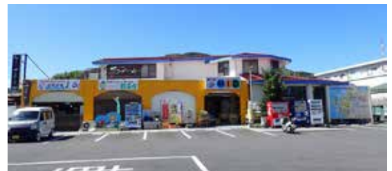
▲愛南町みしょうMIC (愛南町御荘平城4296番地1)