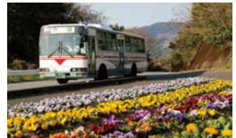
▲昨年度入賞作品「花いっぱい」