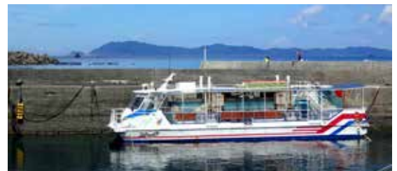
▲旅客船および観光案内待合所 (愛南町船越1599番地)