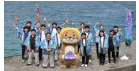
▲動画撮影に臨んだ町職員の皆さん