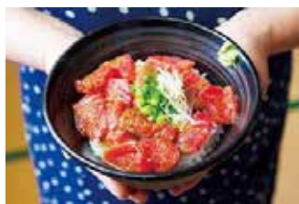
「津久見ひゅうが丼」