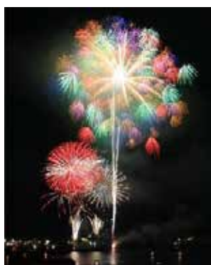
「つくみ港まつり 納涼花火大会」