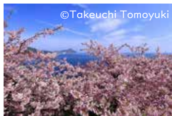
「四浦半島の河津桜」