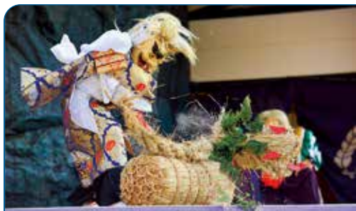
国指定重要無形民俗文化財の御嶽神楽。 力強く華麗で勇壮な舞が特徴。

鋭く尖った稜線や岩壁など荒々しい姿を持つ祖母山は、地域の人々の畏敬の念を集めてきました。