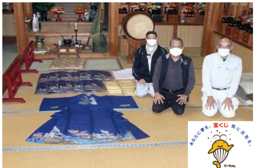
▲「コミュニティ助成事業」の補助を受けて衣装を新調した増田地区のはなとりおどり保存会の皆さん

コミュニティ助成事業は、町が認めたコミュニティ活動(祭り用具の準備等)に必要な備品購入や修繕等に対して助成を行うものです。申請手続きなど、詳しくは総務課にお問い合わせください。