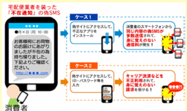
トラブルのイメージ図 (国民生活センターホームページより)