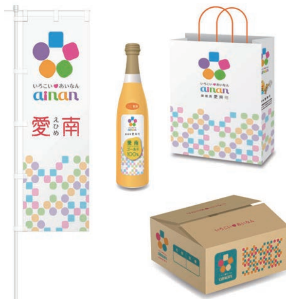
▲ロゴマーク展開例