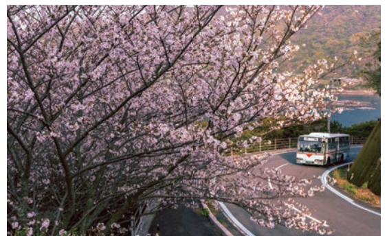
▲昨年度入賞作品(作品名：次は西浦中学校前)