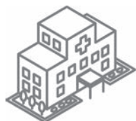
愛媛県立南宇和病院

この春から愛媛県立南宇和病院に赴任された3人の医師と、愛媛大学南予水産研究センターに新たに加わった8人の学生をご紹介します。