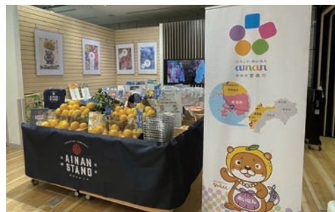
▲東京都庁での販売ブース

1週間特産品販売を行った都庁では、商品を購入してもらったお客さまの感想や反応を聞くことができ、学びや気づきがありました。