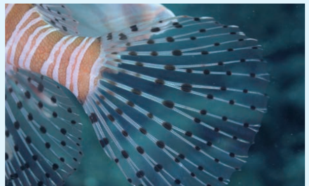
【ハナノミカサゴの尾びれ】

そこで、顔やヒレなどの部分を撮影した。海から上がり、写真を確認していたとき、尾ビレの美しさに心を奪われた。棘条(ヒレの硬いすじの部分)が二股に分かれながら伸び、黒い斑点が規則的に散りばめられている。まるで神様が作ったかと思えないような造形美である。