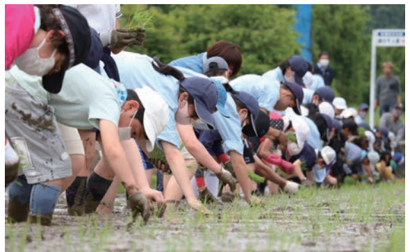
▲苗の合図で一斉に苗を植える児童たち