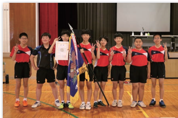
▲卓球団体 優勝 城辺中学校

卓球男子団体戦で優勝した城辺中の主将(3年)は、「去年僅差で負けた悔しさを糧に挑みました。今後も技術力の安定はもちろん重要な場面で力を発揮できるようにして、県大会では自分たちの力を全て出し切りたい」と試合を振り返るとともに意気込みを語りました。