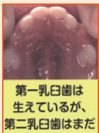
第一乳臼歯は 生えているが、 第二乳臼歯はまだ

大きなものも前歯を使わないで口の奥に押し込むような食べ方になります。食材を小さく切り過ぎず、かじる必要のある大きさにするなどして前歯を使ってかじる練習をしましょう。