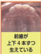
前歯が 上下4本ずつ 生えている

大きなものも前歯を使わないで口の奥に押し込むような食べ方になります。食材を小さく切り過ぎず、かじる必要のある大きさにするなどして前歯を使ってかじる練習をしましょう。