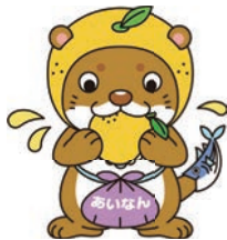
愛南町の観光スポット・絶景を巡るハードなコース約55km