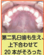
第二乳臼歯も生え、 上下合わせて 20本がそろった

まだ大人と同じものを食べることは難しい段階です。歯が生え始めたら上下がかみ合うまでは、固いものや繊維の強いものをすりつぶすことはできません。