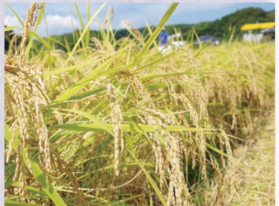
▲天候に恵まれ一粒一粒が立派な仕上がり