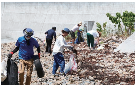
▲町外からもビーチクリーン参加者が集まった

近年の深刻な海ごみ問題について一緒に考え、楽しみながらビーチクリーン活動を行おうと、グリーンパーク須ノ川で『地球と音のカーニバルin愛南』が行われました。