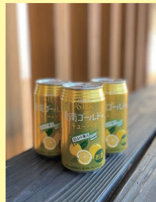
▲愛南ゴールドのチューハイ 内容量：350ミリリットル