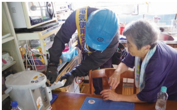
▲組合員から正しい配線方法のアドバイスを受ける

南宇和電気工事組合・(一財)四国電気保安協会・四国電力送配電(株)の3団体が西海地区に暮らす高齢者宅11軒を訪問し、配線状況の確認と安全性の向上につながる配線方法について組合員がアドバイスしました。