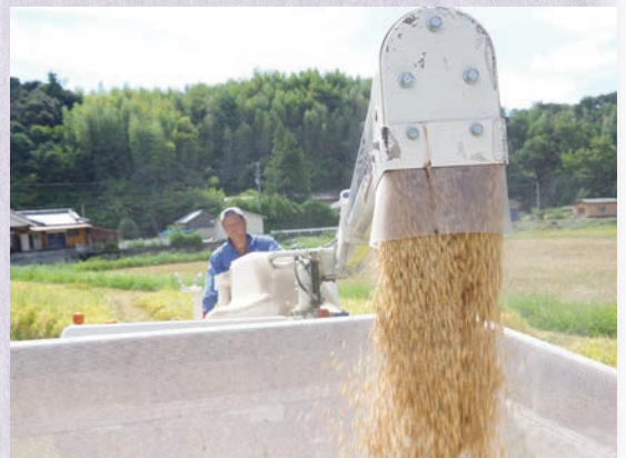
▲コンバインから排出される籾 軽トラで倉庫に運搬し乾燥機に投入します