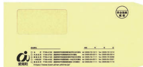
②窓枠付き長形3号 (縦120mm×横235mm)