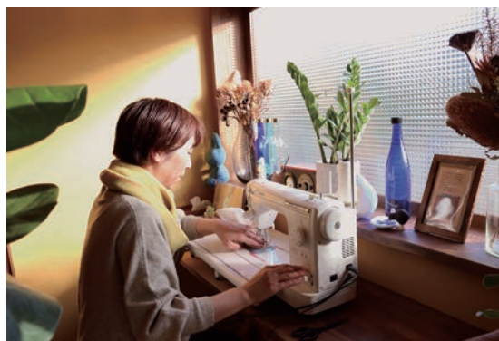
▲カフェの一角に作られた専用のアトリエ。ミシンが奏でる心地良いリズムが店内に響く