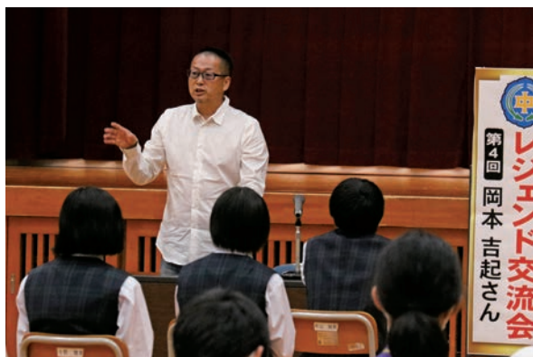
よしき 岡本吉起さん (ゲームプロデューサー)

岡本さんがこれまで手がけてきた数々のゲーム作品は、聞いたこと・やったことあるものばかり。