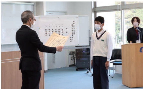
▲中学校を代表して表彰状を受け取る生徒会長