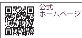
公式ホームページ