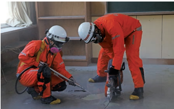
▲エンジンカッターを用いてコンクリート製の床を切断する隊員

解体工事を控えた旧赤水小学校舎を活用して、愛南町消防本部が救助訓練を実施しました。この訓練は、日々の訓練より実践的な環境を再現することができ、応用的な考え方とスキルの向上が図られるため、今後の救助活動につながる効果的な訓練になります。