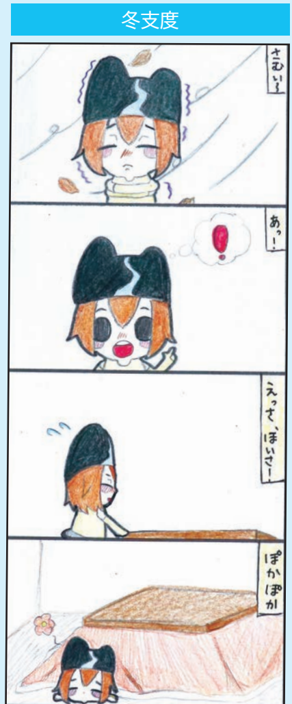
制作: 南宇和高校美術部 鈴木 里桜