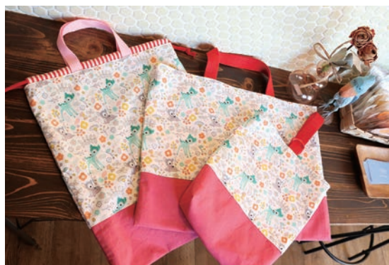
▲今からの時期は体操袋やシューズ入れなど、入園・入学グッズの注文が増える