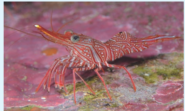
【更紗海老（サラサエビ）】

体長3cmほどの小さなエビで、集団で岩陰に住んでいます。写真を撮ろうと近づくと、ササッ、ササッ、と波が引くように岩の奥へと後ずさりしていきま