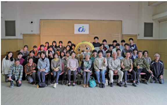
▲受け入れ民家の方々との記念撮影

八幡浜市ふるさと観光公社など南予圏域の地域・団体と連携して修学旅行誘致に取り組んでいる愛南町で、修学旅行生の受け入れを行いました。