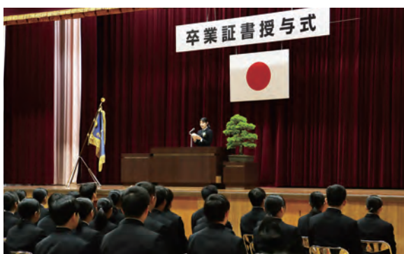
▲3年間の思い出を胸に旅立ちの日を迎える卒業生

保護者や在校生、教員の皆さんの温かな眼差しに見守られながら、農業科13人、普通科67人、総勢80人の生徒たちが卒業の日を迎えました。