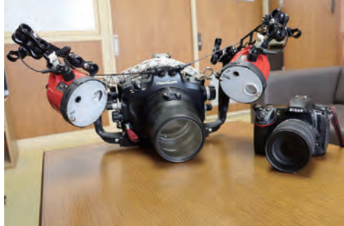
▲3代目の相棒。一眼レフを専用のケースに収め海に潜る。