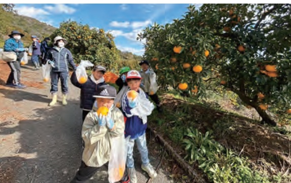
▲自分で収穫したみかんを手に笑顔を見せる児童

令和5年度としては最後の回となる「山と海の学校の交流会」が開催され、船越・緑小学校が合同でみかん狩りを行いました。この交流会は、互いの学校の地域学習や児童同士の交流を目的として行われています。