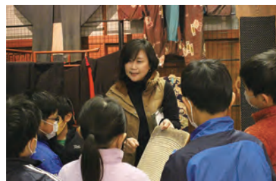
▲講師を務める文化財活用サポーターの様子