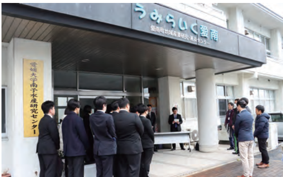
▲悪天候のため、うみらいく愛南の正面玄関に集まって供養の祈りを捧げる出席者の様子

うみらいく愛南で「南予水産研究センター魚介類供養祭」が執り行われ、愛媛大学の学生や教員等、約30人が出席しました。出席者は日頃から実験等に供している水産物の命に感謝するとともに、一人一人が丁寧に献花を行いました。