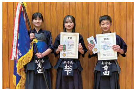
▲深浦スポーツ少年団Aの皆さん