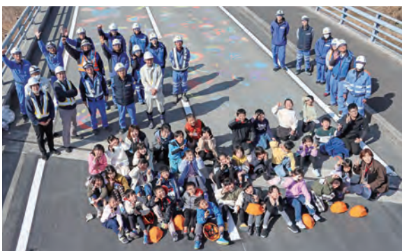
▲見学を終えて最高の笑顔の皆さん

中川地区で行われていた国道56号愛南地区舗装修繕工事の現場見学会が、一本松小学校の1・2年生児童33人を対象に開催されました。