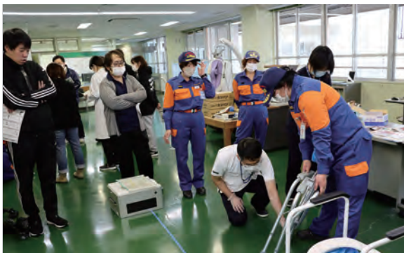
▲愛南町消防団女性部から非常用トイレの設営についてレクチャーを受ける病院関係者

国保一本松病院で「令和5年度第2回消防訓練」が実施され、非常用仮設トイレの設営と備蓄について学びを深めました。病院では、大小合わせて4,000回分の非常用トイレを備蓄する計画を進めています。今回の訓練で、非常用トイレの設営について指導を受けたほか、体験を通して利用者目線での対応についてイメージを深めることができました。