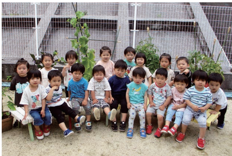
● はまゆう乳幼児保育所 さくら組 (2歳児) 「早く赤くなれ! トマトさん」 毎日、野菜の生育を楽しみにしているさくら組の子どもたちです。

次回(8月号)は、あいなん幼稚園・柏保育所を紹介します。 楽しみにお待ちください!!