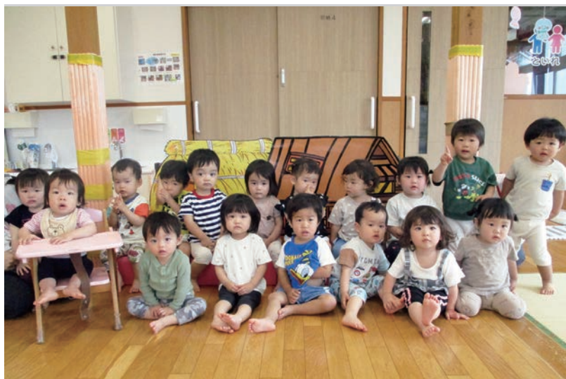
● はまゆう乳幼児保育所 すみれ組 (1歳児) お歌が大好きなすみれ組さん。 今月のお歌は・・・『キラキラ星』だね!