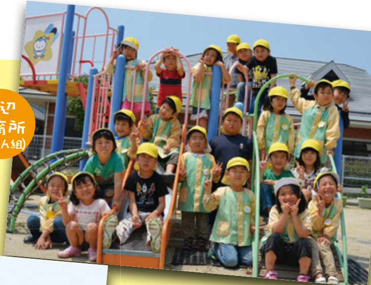
城辺 保育所 (きりん組)