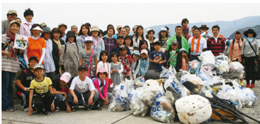
えひめ南予いやし博2012が開幕し、愛南町でも、オープニングイベントの「GO-MIX」や「愛南ファミリー釣り大会」のほかさまざまなイベントが行われました。(4/22～)【P19参照】