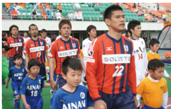
ニンジニアスタジアム(県総合運動公園陸上競技場)で、愛媛FCとロアッソ熊本のJ2公式戦(第9節)が上島町と愛南町のマッチタウンゲームとして開催され、御荘サッカースクールの子どもたちがエスコートキッズを務めました。(4/22)【P18参照】