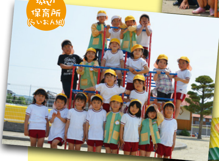
城辺 保育所 (らいおん組)