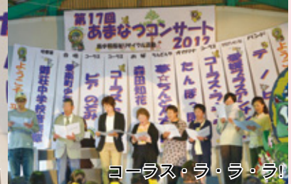
コーラス・ラ・ラ・ラ!