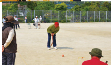
町内外で各種スポーツ大会が行われ、子どもからお年寄りまで、選手の皆さんが日頃の練習の成果を存分に発揮しました。(4/21～)【P20～21参照】