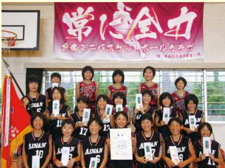
優勝 愛南ミニバスケットボールクラブ