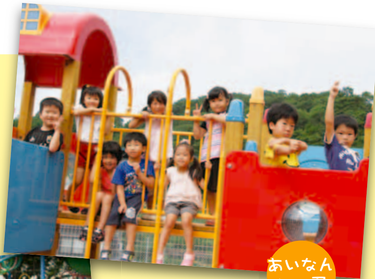
あいなん 幼児保育園