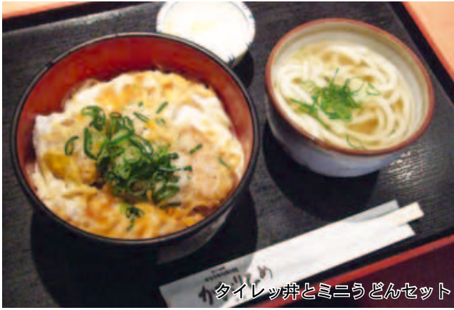
タイレッ丼とミニうどんセット