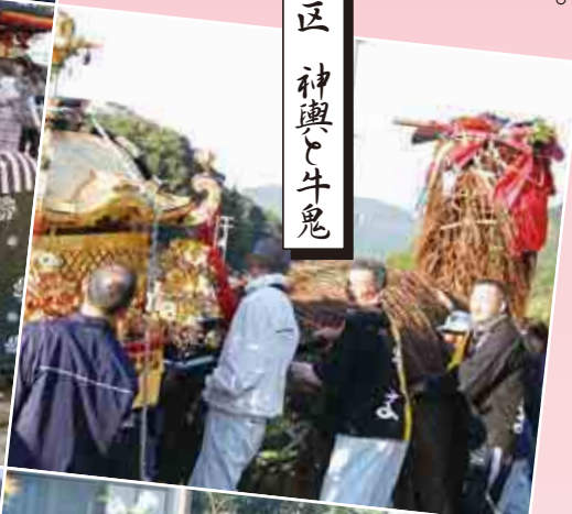
小山市 神輿と牛鬼