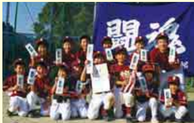
2部優勝 家串スポーツ少年団