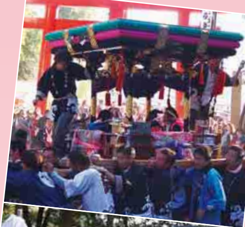
平城五帯会 四つ太鼓