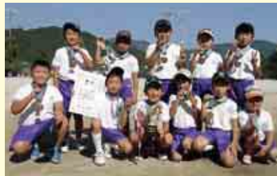
3部優勝 緑スポーツ少年団