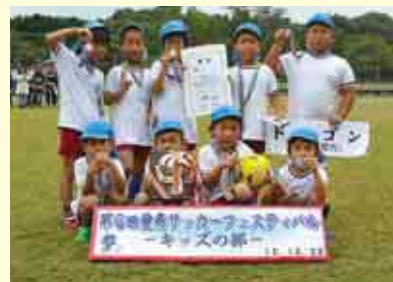
準優勝 ドラゴン(城辺保育所)