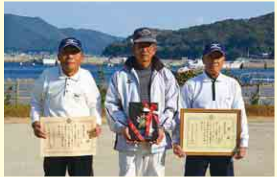
クロッケー 久家チーム