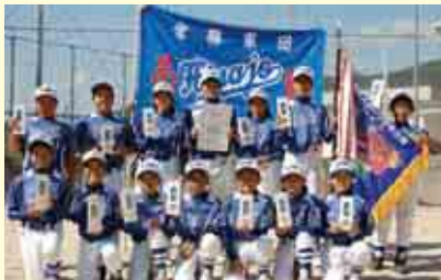
1部優勝 平城スポーツ少年団