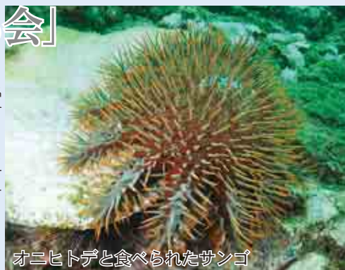
オニヒトデと食べられたサンゴ