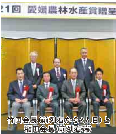
竹田会長(前列右から2人目)と稲田会長(前列右端)