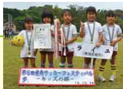
優勝 ライユ(東海保育所)

キッズの部 優勝 ライユ(東海保育所) 準優勝 ドラゴン(城辺保育所) 3位 フリーザ(緑保育所)、ウィザード7(一本松保育所)