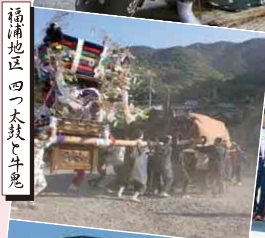
福浦地区 四つ太鼓と牛鬼