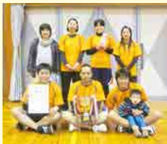
1部優勝 ゴーヤンズ