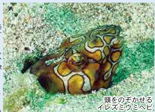
頭をのぞかせる イレズミウミヘビ

ウミヘビといっても愛南町に住んでいるのは、すべてアナゴの仲間です。ですから毒ありません。体が細長く、悪そうな顔つきをしているアナゴの仲間を、〇〇ウミヘビと呼ぶようになったようです。写真のイレズミウミヘビも恐ろしい顔つきをしていますが、いたって穏やかな性格です。昼間は砂地から頭だけを出して周りの様子をうかがっています。ダイバーが近づくとソロリ、ソロリと砂の中に潜ってしまいます。夜になるとはい出して、小さなエビやカニなどを食べているようです。