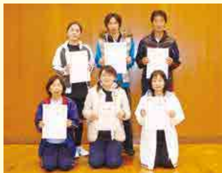
男女混合ダブルスの部優勝 アルル