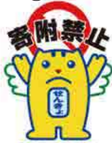
政治家の寄附禁止

政治家候補者、候補者になる者、現に公職にある者（は、寄附をする）と処罰されます。