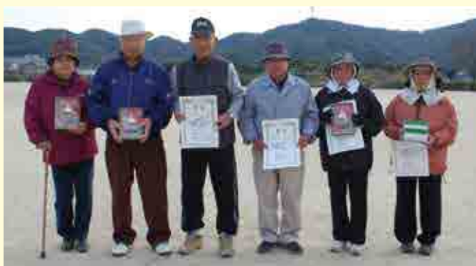
1部優勝 一本松A(写真左から3名) 2部優勝 広見B(写真右から3名)