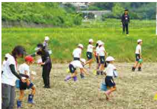
11月16日に開催された「菊川地区コスモス祭り」に向け、菊川小学校の児童20名が、同校前の田んぼにコスモスの種をまきました。(9/6)【P18参照】

四国のへんろ道を歩くイベント「トレッキング・ザ・空海あいなん」が今年も開催され、参加者は、長い道中の合間に設けられた接待所での心温まる「お接待」に癒されました。(11/17、18)【P18参照】