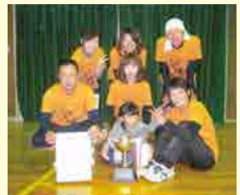
2部優勝 ワンピース