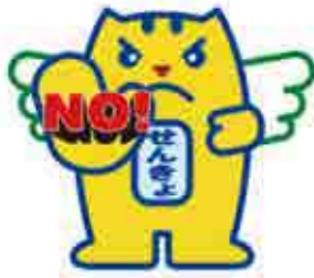
贈らない・求めない・受け取らない