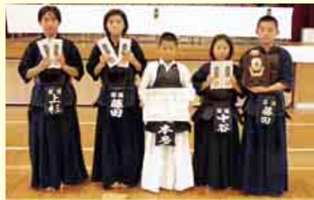
団体戦高学年の部準優勝 深浦スポーツ少年団