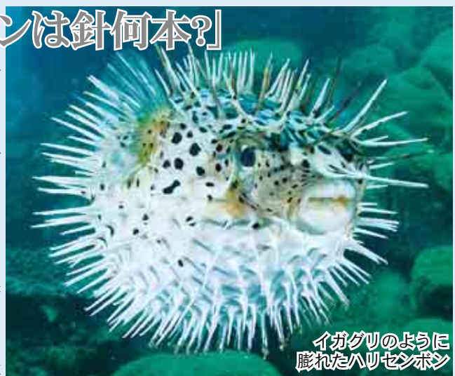
イガグリのように膨れたハリセンボン