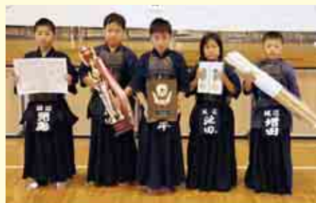
団体戦低学年の部優勝 城辺子供剣道会A