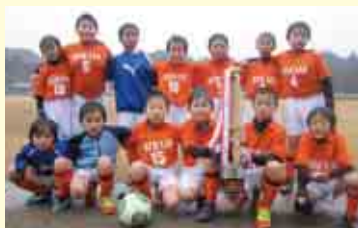
2部優勝 平城サッカークラブU-10