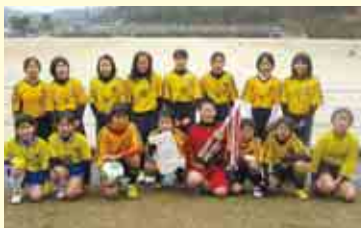
1部B優勝 菊川・船越連合