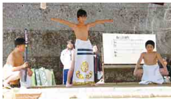
福浦地区の伝統行事「薬師如来奉納相撲大会」が今年も開催され、紅白両横綱がそれぞれ太刀持ちと露払いを従えて土俵入りし、大会が幕を開けました。(1/8)【P23参照】