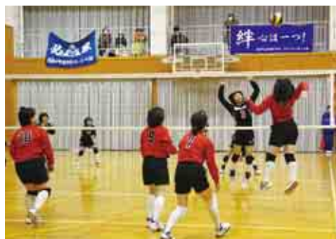
中学生チームと一般クラブチームが参加した「第8回愛南町女子6人制バレーボール交流大会」では、バレーボールを通して世代を超えた交流が図られました。(1/13)【P25参照】

「第15回南宇和サッカー協会杯小学生サッカー大会」が南レク城辺公園芝球技場ほかで開催され、参加した選手が元気いっぱいのプレーを見せました。(1/13)【P25参照】