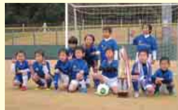
3部優勝 平城サッカークラブアンフィニ