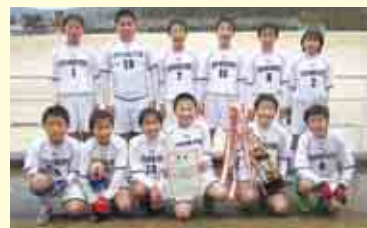
1部A優勝 一本松少年サッカークラブA