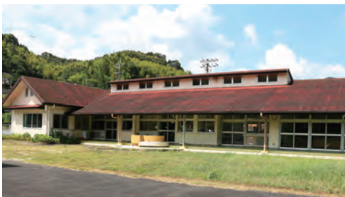
▲移転予定先の旧正木保育所

この度、改修を終え10月より業務を開始します。今後、公民館を中心として地区住民の方が気軽に集うことができるよう努めていきたいと思っております。