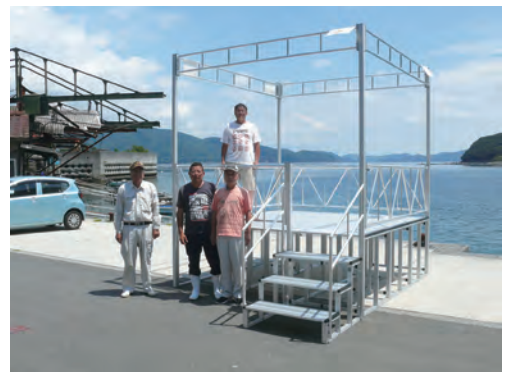
▲新設した櫓と油袋地区自治会の皆さん