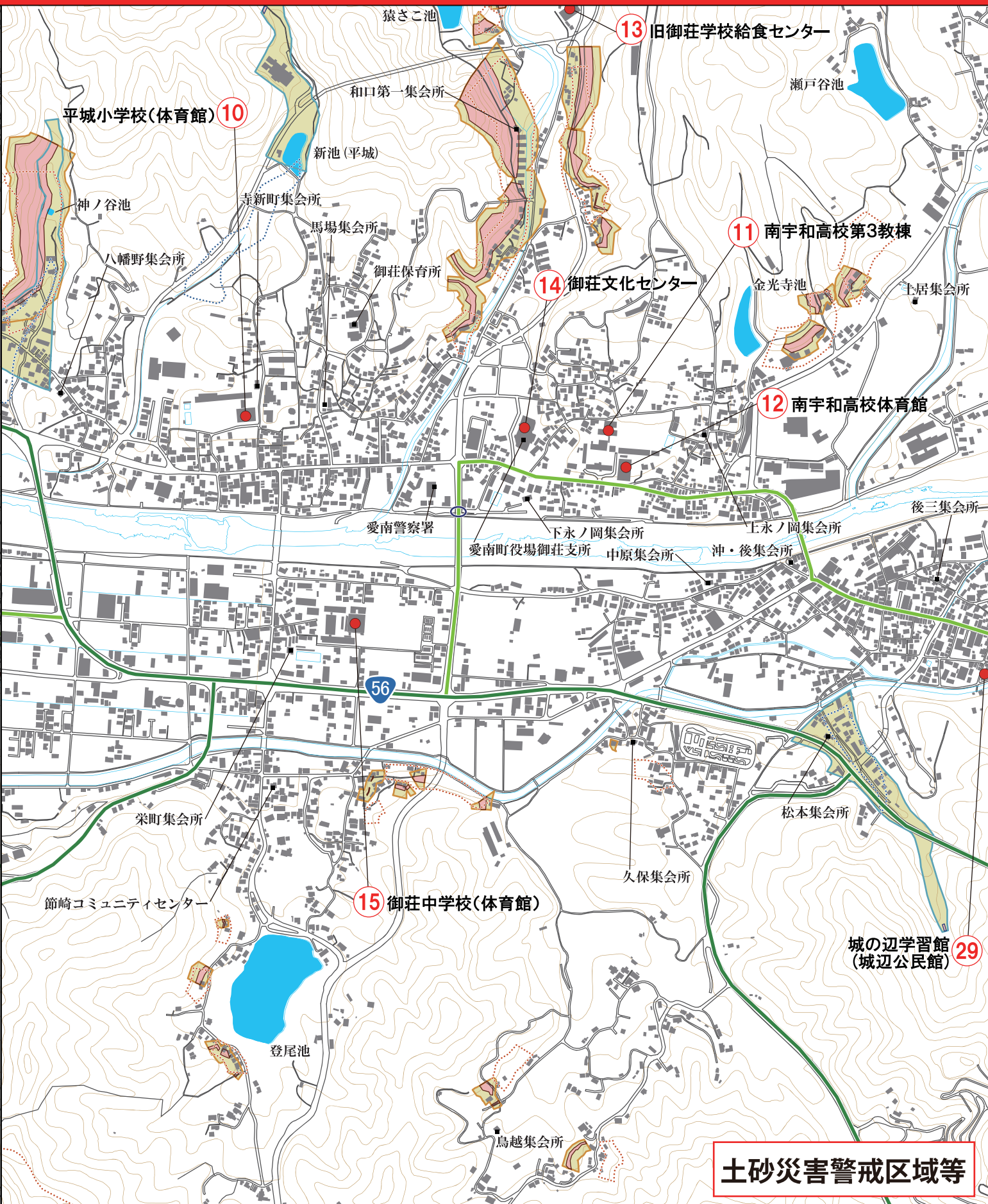
土砂災害警戒区域等